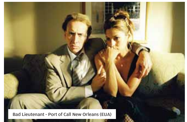
Bad Lieutenant - Port of Call New Orleans (EUA)

Mantêm-se as salas do São Jorge, Londres e City Classic Alvalade.