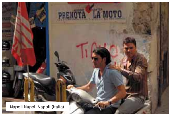
Napoli Napoli Napoli (Itália)